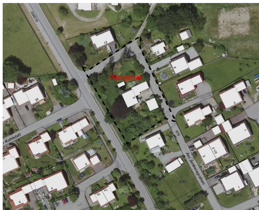
Luftbild mit Flurkarte unmaßstäblich

Das Plangebiet umfasst eine Fläche von ca. 0,3225 ha.